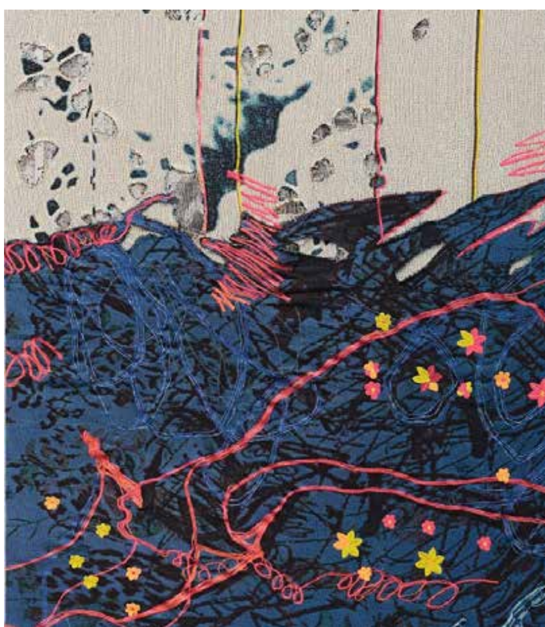
Navy drift, 2018