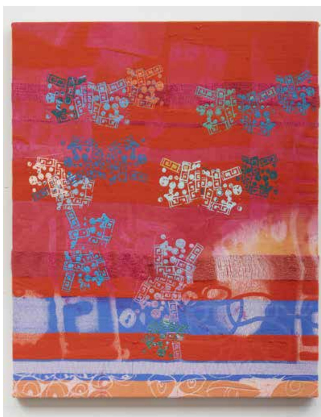
afternoon repeat, 2018

ENGLISH TRANSLATION (not provided by author)