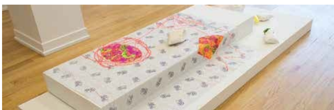
Cositas de casa, House things, 2018