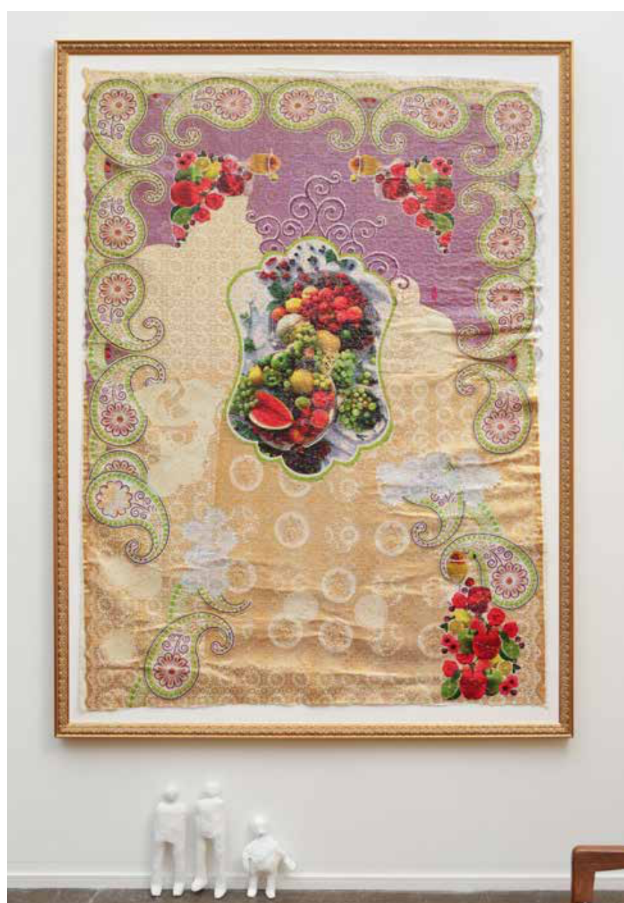
Mesa de Frutas no.2, Table of Fruits no.2, 2019